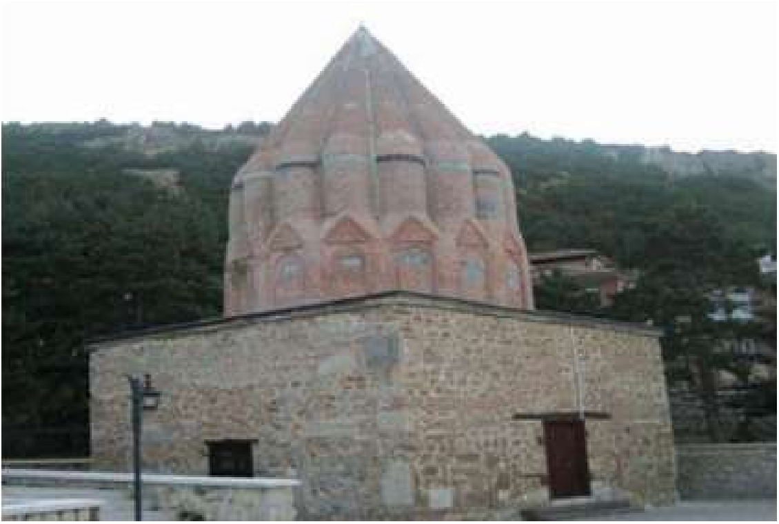
Resim 1: Seyyid Mahmud Hayrani Türbesi, (Ali Kozan, “Türkiye Selçukluları Devrinde Akşehir’de Bir Sufi: Seyyid Mahmud Hayrani ve Zaviyesi”, Vakıflar Dergisi, Sayı: 38, Yıl: 2012, s. 58. )